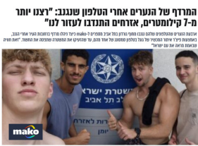
המרדף של הנערים אחרי הטלפון שנגנב: "דענו יותר מ-7 קילומטרים, אחרים התנדבו לעזור לנו"