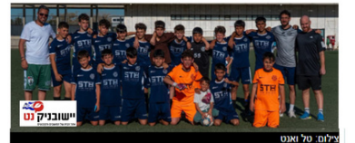
הממלחמה לאליפות: הילדים של בני שמעון עשו עונה חלומית, חזרו מהמלחמה וסיימו עונה עם גביע בעונה הראשונה שלה בלבד, קבוצת הילדים ב' של הפועל בני שמעון הישג יוצא דופן וזכתה באליפות ליגת דרום 1 עם מאזן כמעט מושלם של 17 ניצחונות והפסד אחד בלבד.