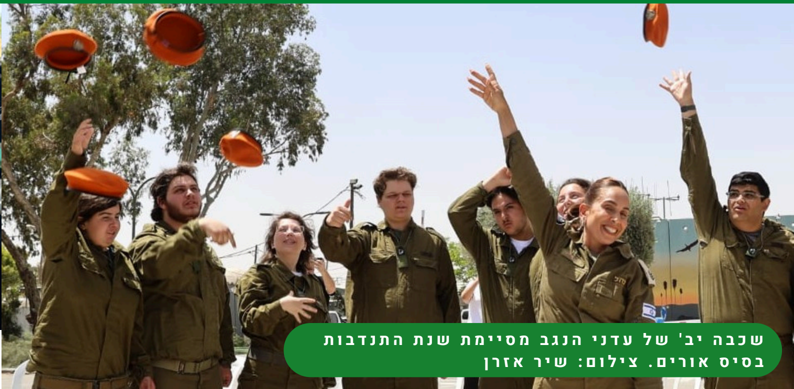
שכבה יב' של עדני הנגב מסיימת שנת התנדבות בסיס אורים.