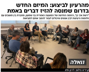
מהרעיון לביצוע: המיזם החדש בדרום שמנסה להזיז דברים באמת "ישת איר 20", היממה החדשה של המועצה המחוקקת בני שמעון, מחברת בין חובבים עם חלומות ורעיונות לבין אנשים שיכולים לעזור להפוך אותם למציאות

המיזם החדש שמנסה להזיז דברים באמת גם "יישובניק-נט" וגם אתר "וואלה" התלהבו מאד מיוזמת "רשת איך כן" שלנו - קהילה חדשה שמחברת בין תושבים עם יוזמות ורעיונות לבין אנשים שיכולים לעזור לקדם אותם בפועל: דרך חיבורים, ליווי, חשיבה משותפת ופתרון חסמים.