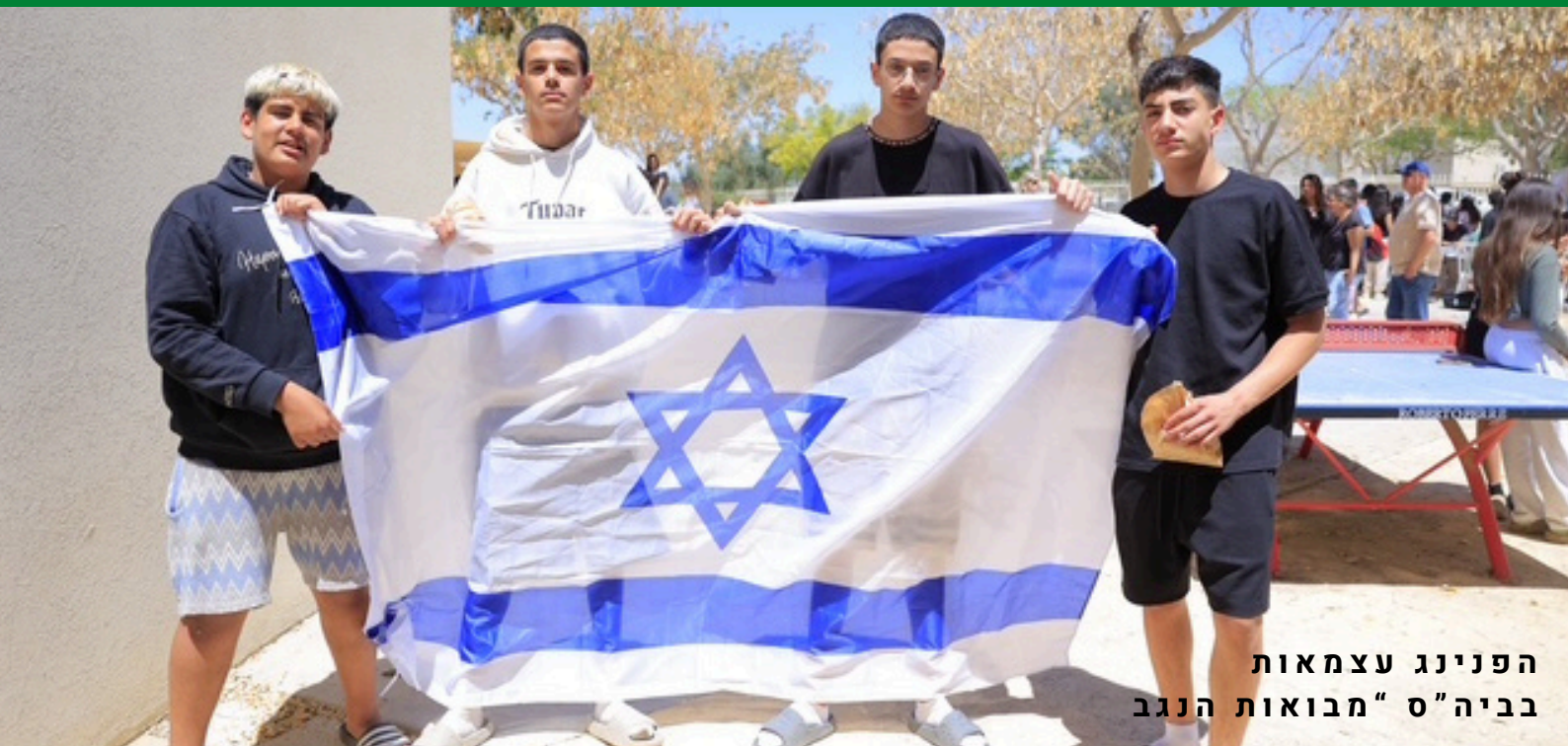
הפנינג עצמאות בביה"ס "מבואות הנגב"