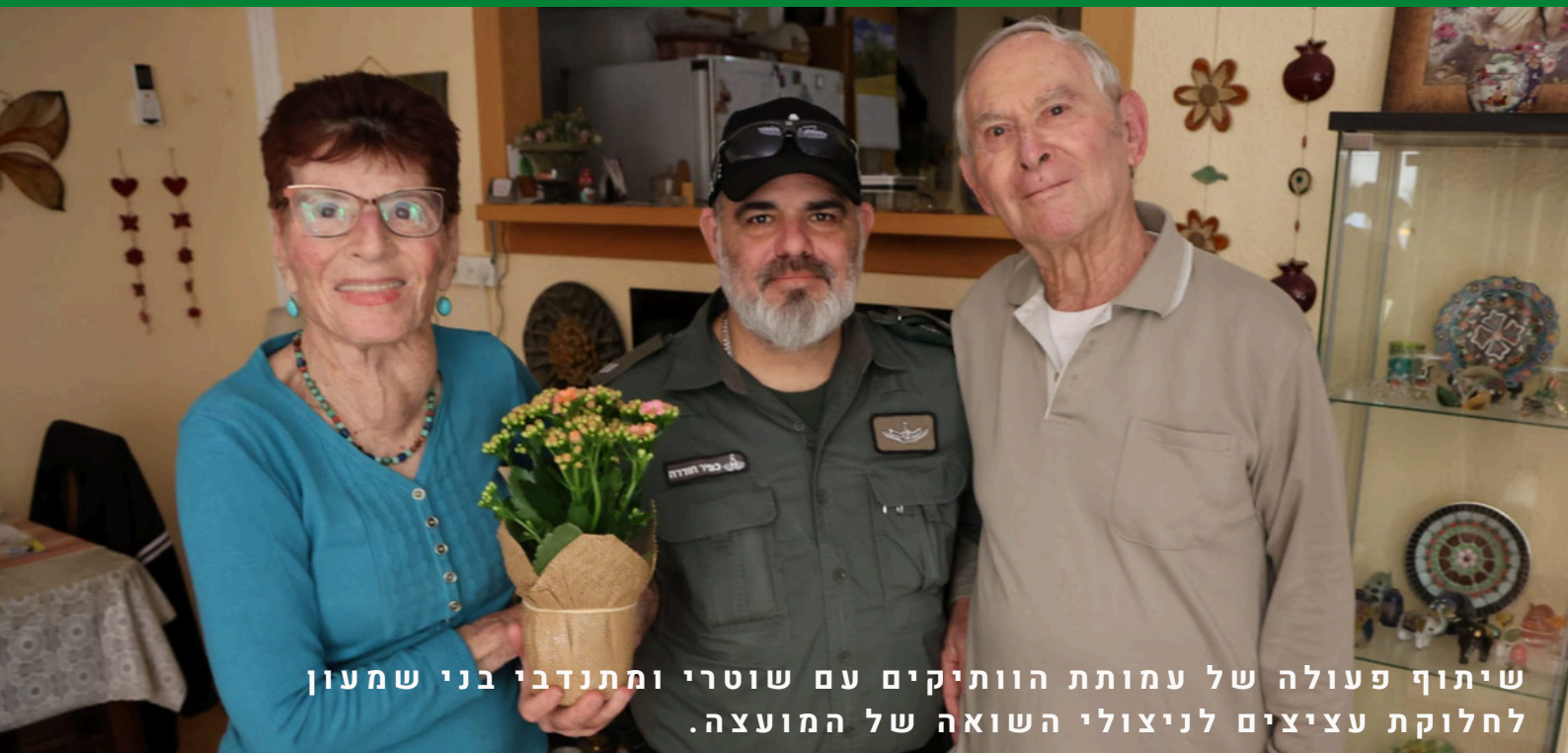
שיתוף פעולה של עמותת הוותיקים עם שוטרי ומתנדבי בני שמעון לחלוקת עציצים לניצולי השואה של המועצה.