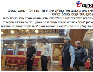
קר שבע שורשים מהגב ועד קוצ'ין: שגרירות הודו וילדי מושב נבטים נטעו 300 עצים בטקס מרגש במסגרת יזמה של ראש ממשלת הודו, הגיעו השבוע שגריר הודו והשרה עיידת סילמן למושב נבטים שבמועצה האזורית בני שמעון. יחד עם הקהילה המקומית, יוצאי קוצ'ין, ציינו את ס' בטקס בוטיעות שסימלו את הקשר העמוק בין החדינות