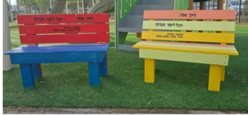
הספסלים בני שמעון

תלמידי בית הספר "עדני הנגב" יזמו והקימו ספסלי חברות שנתרמו לגני הילדים במועצה האזורית בני שמעון. המיזם נולד במסגרת חונכית יזמות חברתית ומקדם ערכים של שייכות, אכפתות ועזרה הדדית.