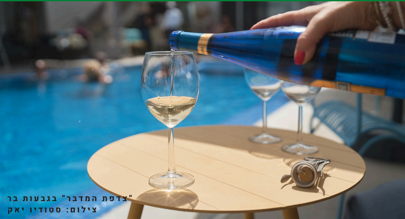
"צדפת המדבר" בגבעות בר