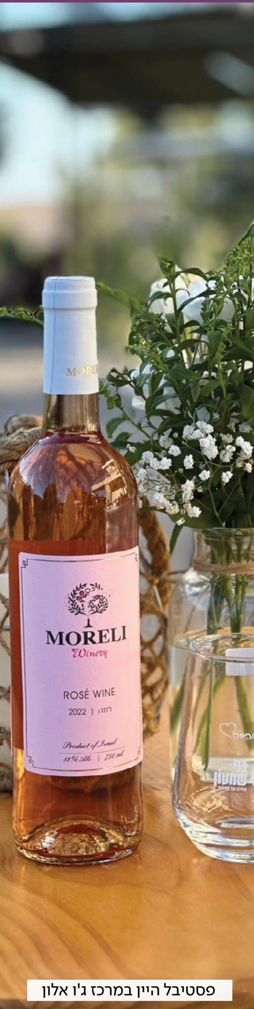
פסטיבל היין במרכז ג'ו אלון