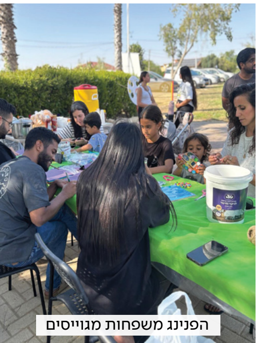
הפנינג משפחות מגויסים