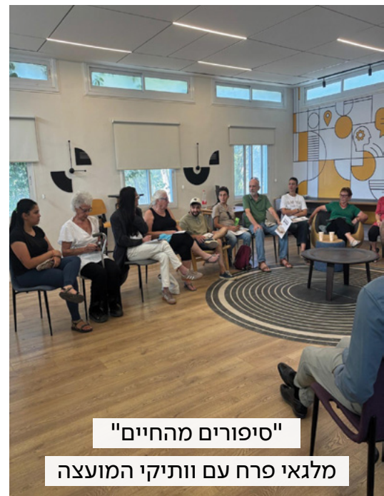
"סיפורים מהחיים" מלגאי פרח עם וותיקי המועצה