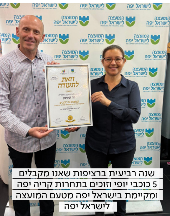
שנה רביעית ברציפות שאנו מקבלים 5 כוכבי יופי וזוכים בתחרות קריה יפה ומקיימת בישראל יפה מטעם המועצה לישראל יפה