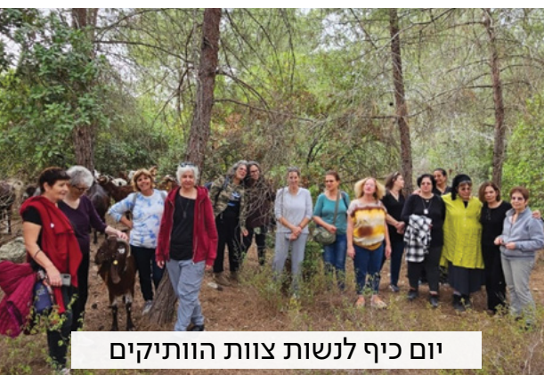
יום כיף לנשות צוות הוותיקים

המטרה: ליצור מרחב שבו וותיקות וותיקים לא רק משתתפים, אלא מובילים, תורמים ומשפיעים על פני הזיקנה בקהילה שלנו.