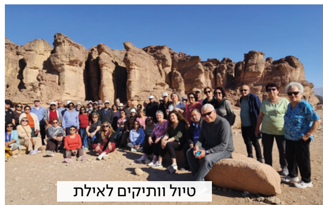
טיול וותיקים לאילת