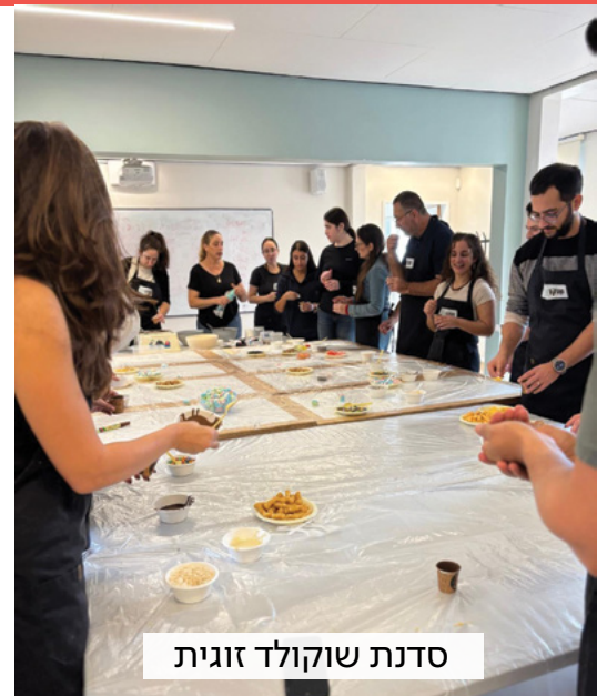
סדנת שוקולד זוגית