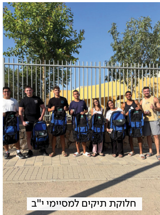
חלוקת תיקים למסיימי י"ב