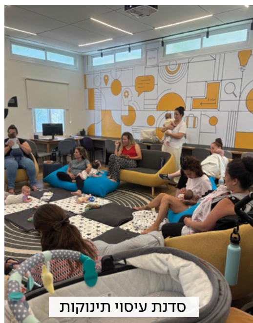
סדנת עיסוי תינוקות