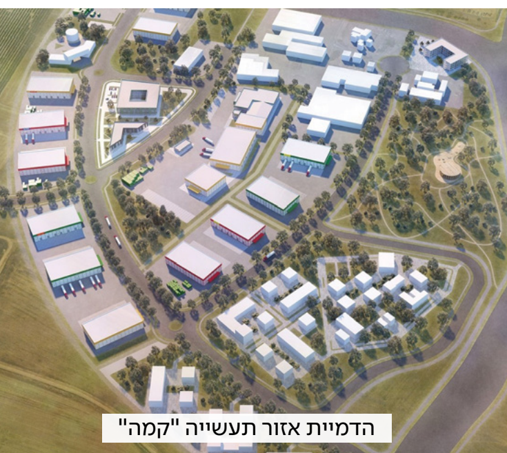
הדמיית אזור תעשייה "קמה"